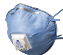
filtrační polomaska 9926