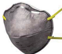
filtrační polomaska 9913