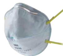
filtrační polomaska 9906