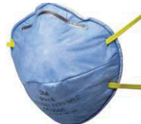
filtrační polomaska 9915