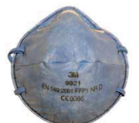
filtrační polomaska 9921