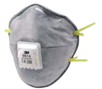
filtrační polomaska 9914